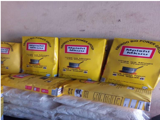
Kielelezo Na. 5: Bidhaa kutoka KBPG inayofamika kama “Mpishi Mkuu”. Bidhaa hii ipo tayari kwa kuuzwa na kuongeza kipato kwa wakulima.