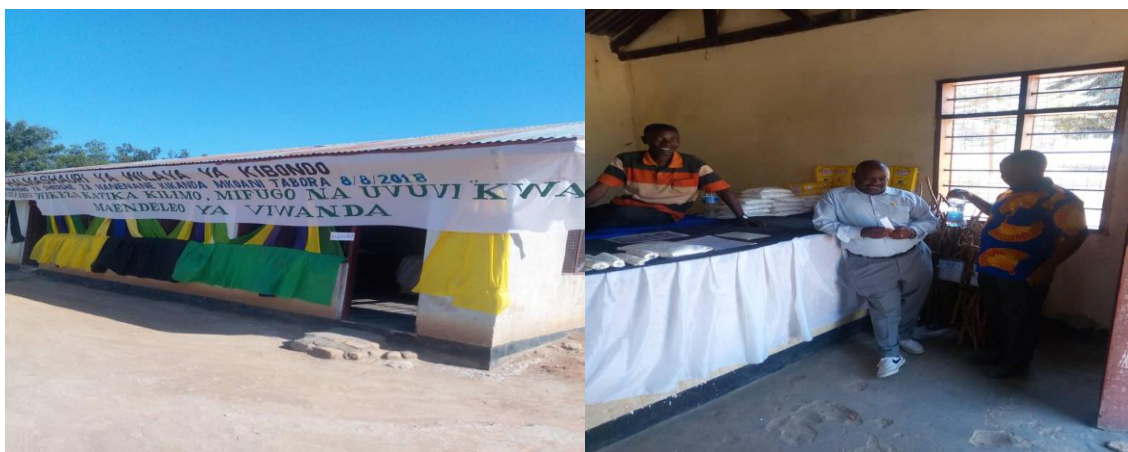
Kielelezo Na. 7: Banda la Halmashauri ya Wilaya Kibondo lililotumika kwa ajili kuonesha na kuuza bidhaa kutoka KBPG katika maonesho ya nanenane huko mkoani Simiyu mwaka 2018.

Vilevile, kikundi kimepata fursa ya kushiriki katika maadhimisho ya Sherehe za Wakulima (nanenane) yaliyofanyika Kitaifa katika Mkoa wa Simiyu mnamo mwaka 2018. Aidha, uzalishaji wa mazao umeongezeka kutoka Tani 60 kwa msimu wa mwaka 2016/17 na kufikia Tani 80 kwa msimu wa mwaka 2017/18.