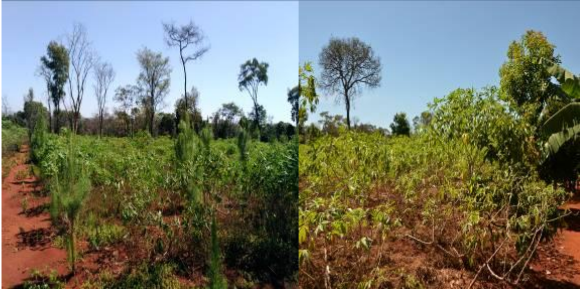
Kielelezo Na. 2. Picha ya upande wa kushoto inaonesha aina mbalimbali ya mihogo ikiwa imetenganishwa na miti ya aina mbalimbali. Picha ya upande wa kulia inaonesha aina nyingine za mazao kama maparachichi na migomba.