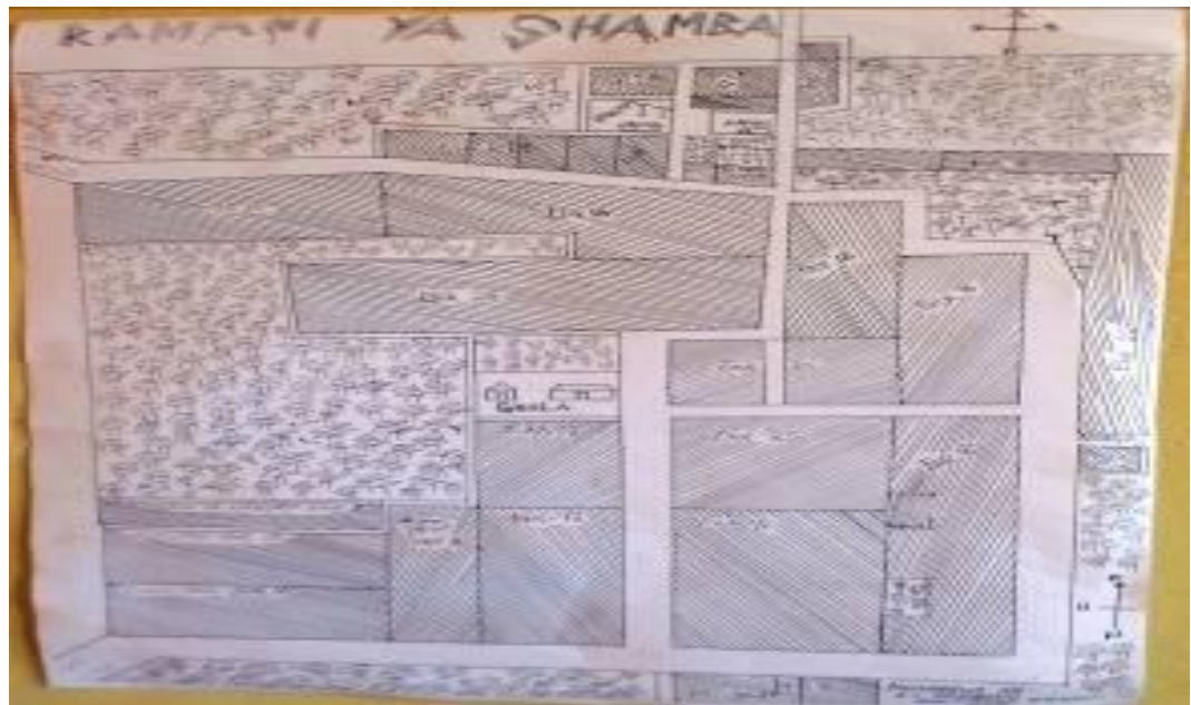
Kielezo Na. 1: Mchoro wa Shamba la KGB

Kwa kuzingatia kuwa shughuli kubwa inayofanyika katika Halmashauri ya Kibondo ni Kilimo, KGB iliamua kujikita katika kilimo. Mkuu wa Wilaya aliwapatia hekta 200. Aidha, Wilaya ilikamilisha taratibu zote za kisheria kuhusu umiliki wa Ardhi. Pia, Wilaya ilikipatia kikundi majembe ya mkono na mapanga tayari kwa kuanza shughuli za kilimo cha mihogo na mazao mengine ya biashara na chakula.